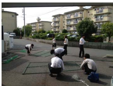
緑のカーテン用のネットを張っているところです

カリウムやカルシウムなどミネラルも豊富で暑さで消耗された体力を回復させることができ、夏バテ防止にはピッタリの食材です。